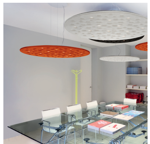
SILENT FIELD 2.0 Fotos: Artemide