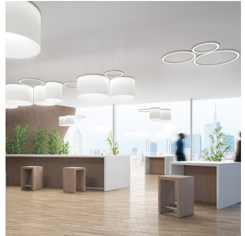
RIPPLE Fotos: Artemide