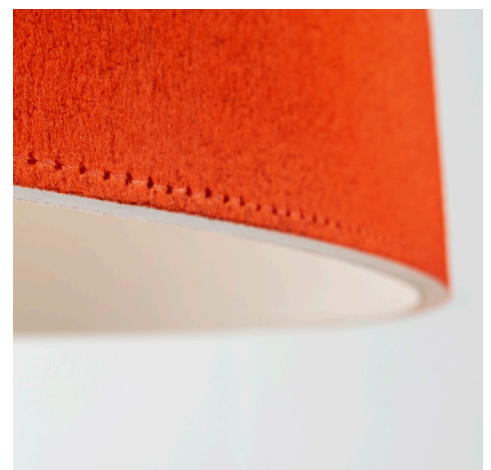
NUR ACOUSTIC Fotos: Artemide