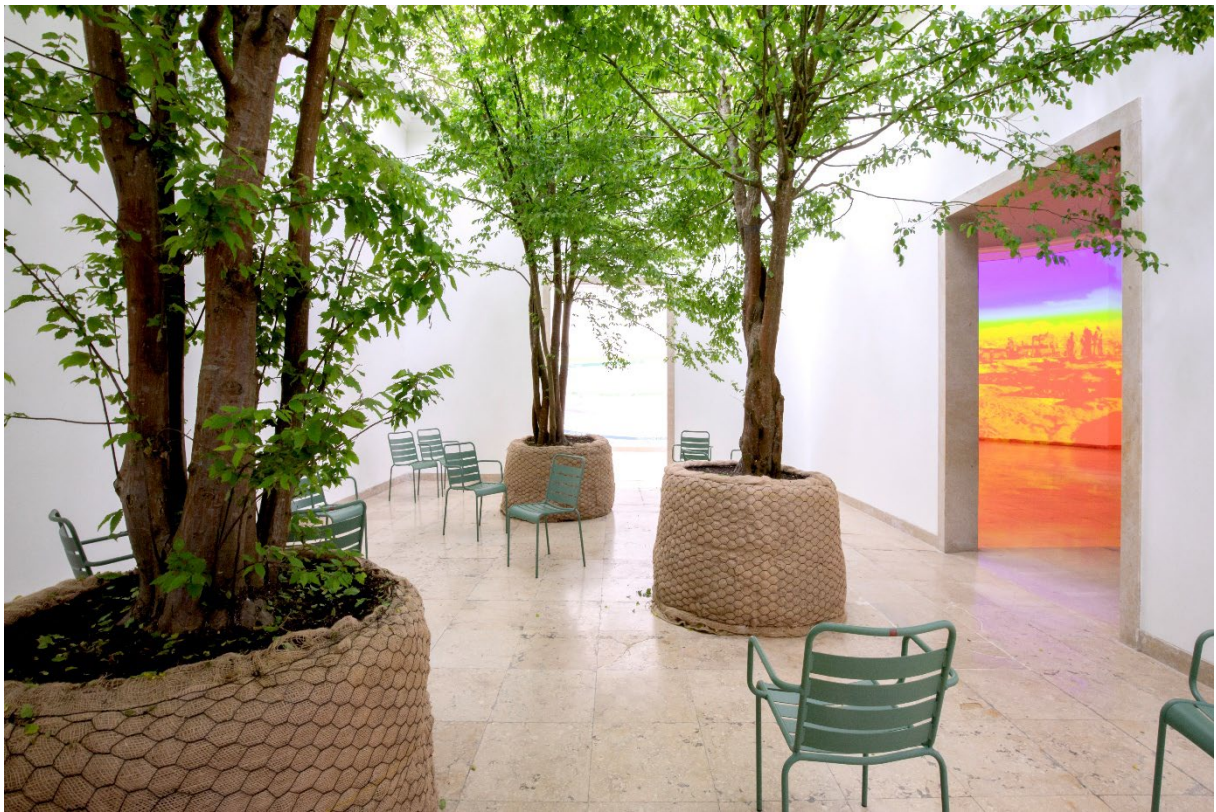
Ausstellung im deutschen Pavillon.