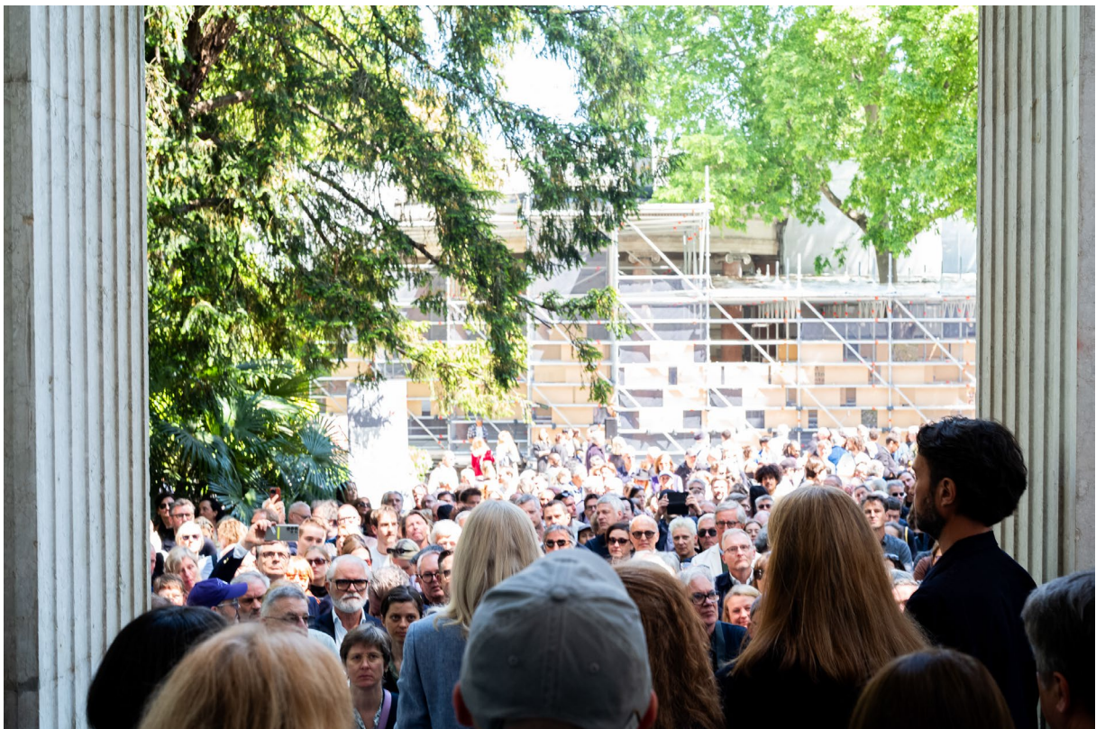
Eröffnungsveranstaltung Deutscher Pavillon.