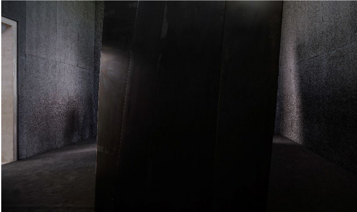
NYLTECC 700 im deutschen Pavillon.