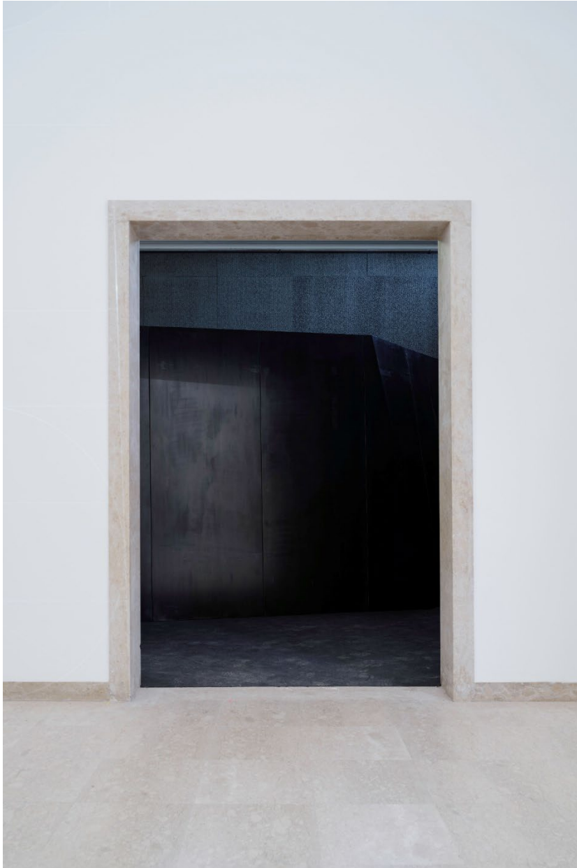
NYLTECC 700 im deutschen Pavillon.