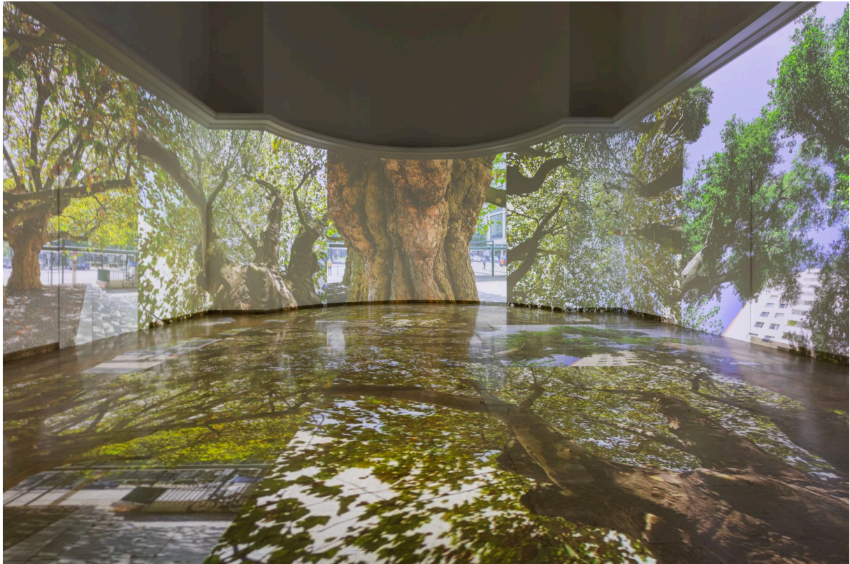
Ausstellung im deutschen Pavillon.