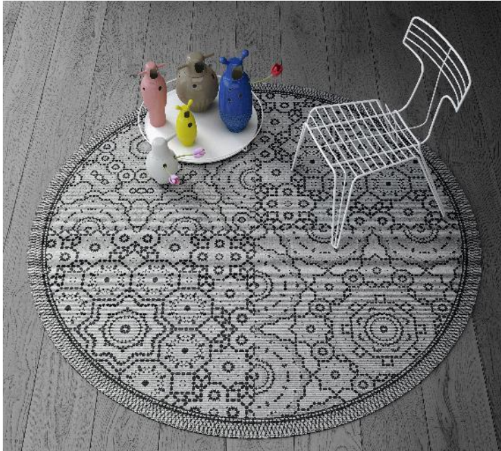
RUGXSTYLE AARHUS 623