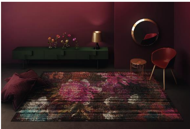
RUGXSTYLE AMSTERDAM 42I