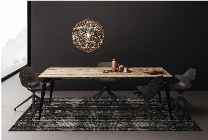
RUGXSTYLE ABERDEEN 321