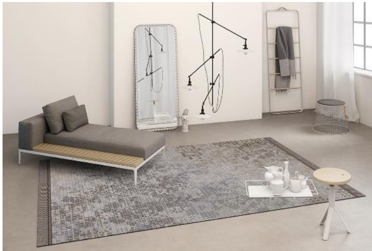
RUGXSTYLE ANTWERP 521