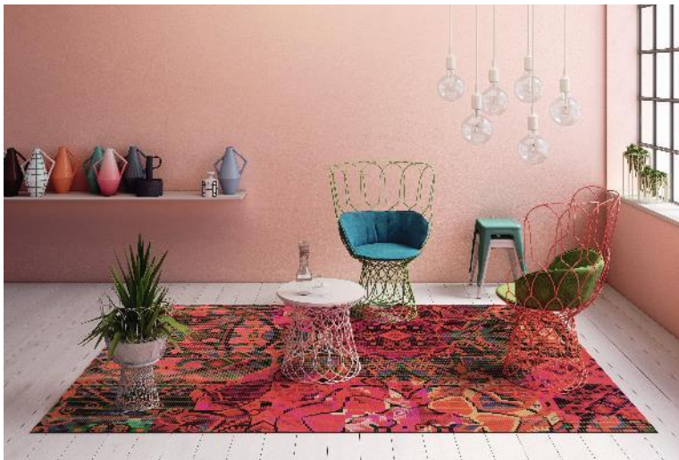
RUGXSTYLE MARRAKESH IIII

Langlebigkeit punktet, haben Kunden lange Freude an den farbenfrohen RUGXSTYLE -Teppichen – sowohl im privaten Wohnbereich als auch im stark frequentierten Objektbereich.