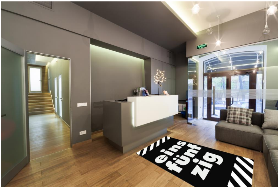
Bild: Hotel Design EINS FÜNF ZIG 1x2m, THE SAFEZONE