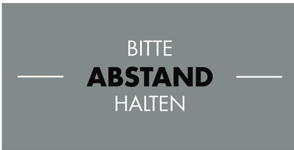
Bild: Design BITTE ABSTAND HALTEN 2x1m, THE SAFEZONE