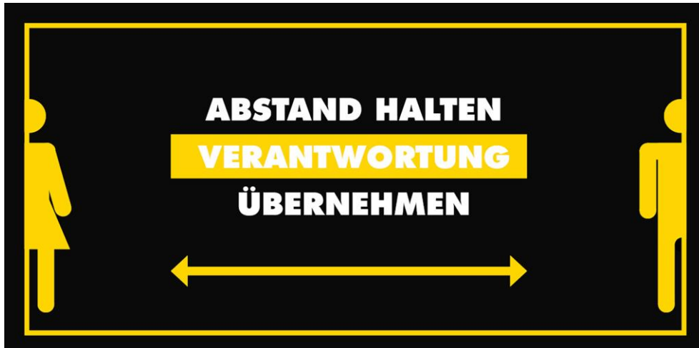
Bild: Design VERANTWORTUNG ÜBERNEHMEN 2x1m, THE SAFEZONE