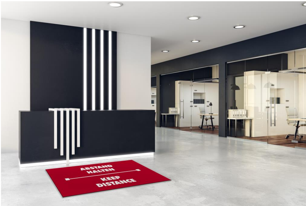
KEEP DISTANCE 2x1m, THE SAFEZONE