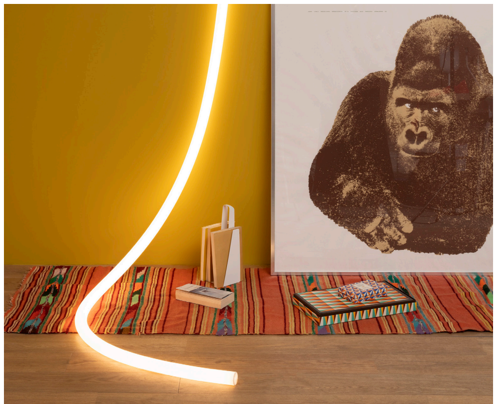
La Linea