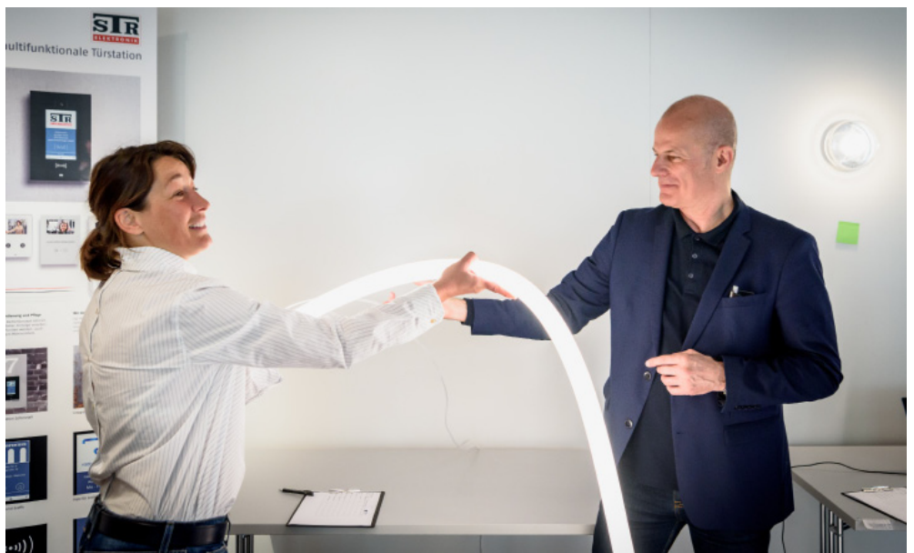
La Linea beeindruckt die Fachjury des AIT Innovationspreises Architektur + Technik 2020 am meisten.