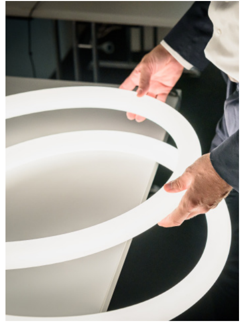
La Linea vereint optimale Lichtqualität, Flexibilität und außergewöhnliches Design.