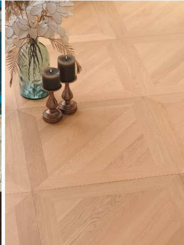
EICHE Tafelparkett A, gebürstet, weiß geölt