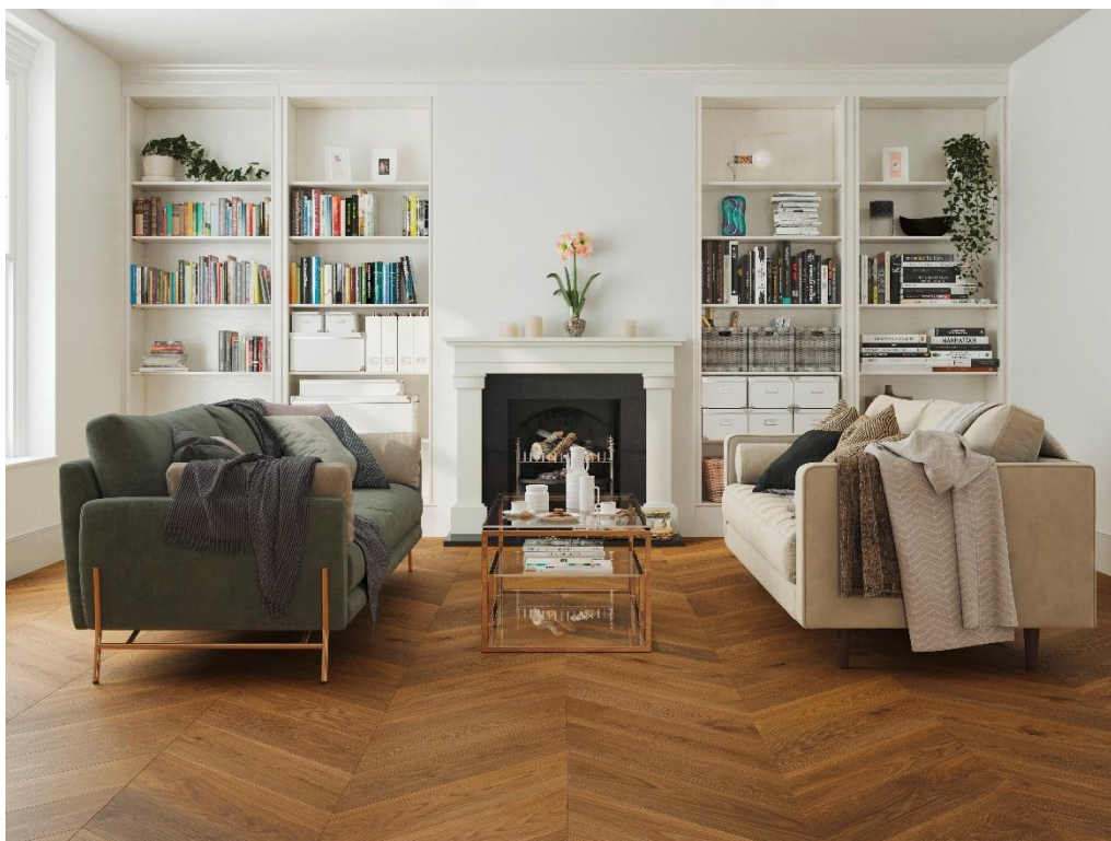
EICHE Vulcano Medium Chevron 45°, gebürstet, natur geölt