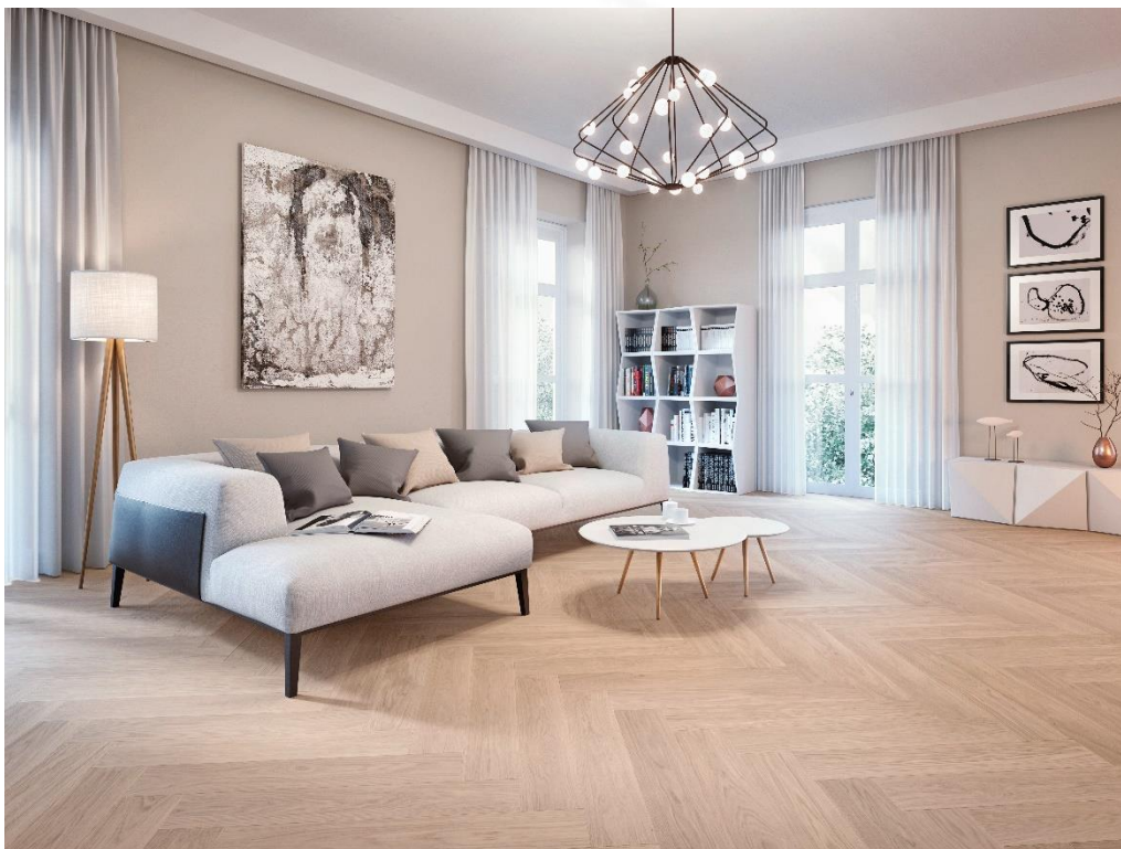
EICHE Astrein Fischgrät 90°, gebürstet, weiß geölt