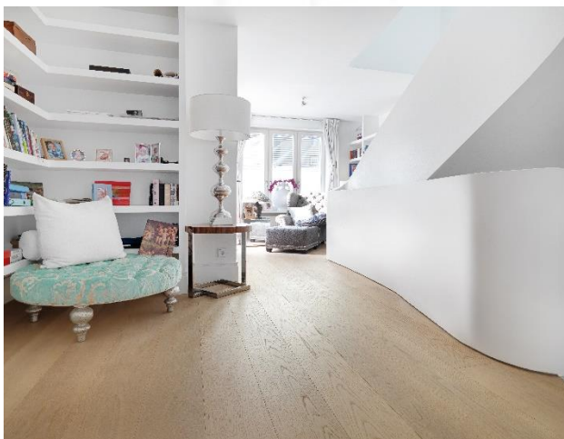
EICHE Astrein Breitediele, gebürstet, weiß geölt