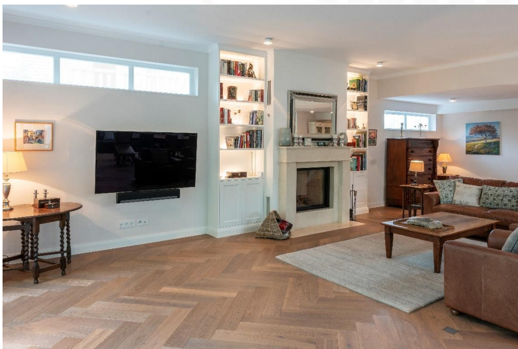
EICHE Vulcano Medium Fischgrät 90°, gebürstet, weiß geölt