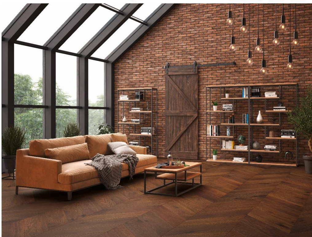
EICHE Vulcano Chevron 45°, gebürstet, natur geölt