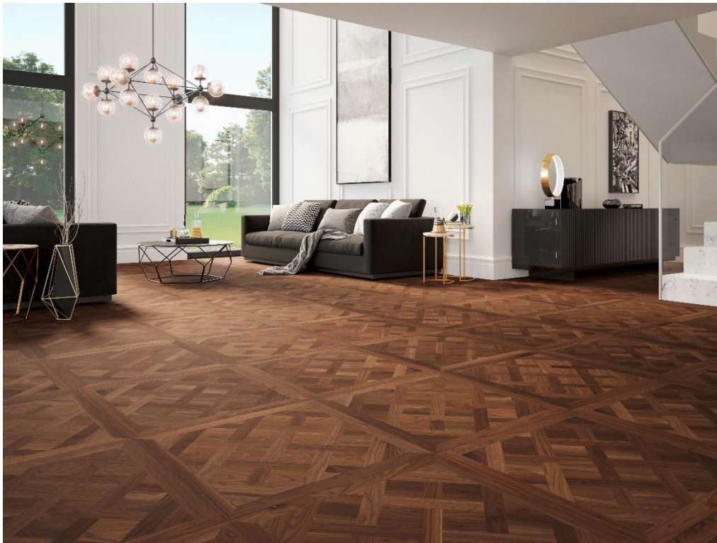
NUSS USA Tafelparkett D, geschliffen, natur geölt