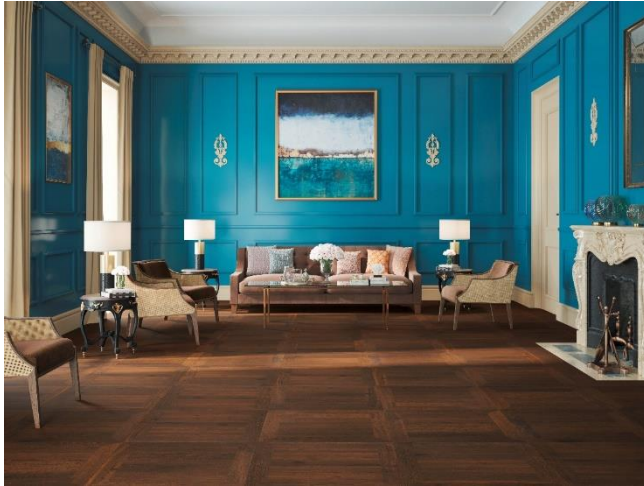
EICHE Vulcano Tafelparkett B, gebürstet, natur geölt