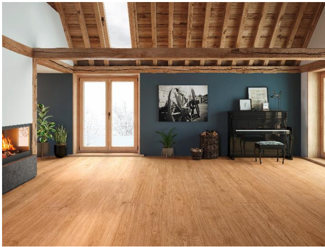
EICHE Astarm Breitediele, gebürstet, natur geölt