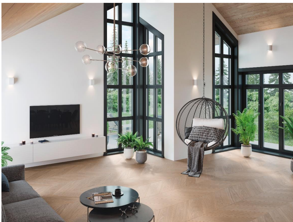
EICHE Astrein Chevron 45°, gebürstet, weiß geölt