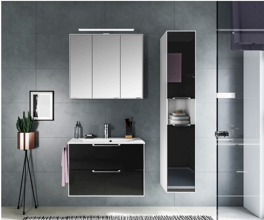
links: Fokus 3065 mit weißem Korpus und Fronten in Glas Schwarz rechts oben: Fokus 4030 in Anthrazit Hochglanz rechts unten: Balto in Anthrazit Hochglanz mit schwarzer Zierleiste