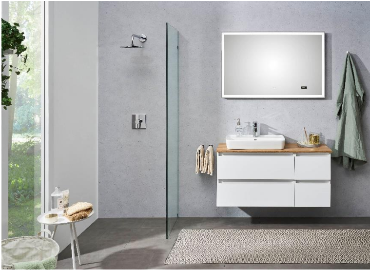
Funktionsspiegel mit Effektlucht und Digitaluhr (Programm Balu)