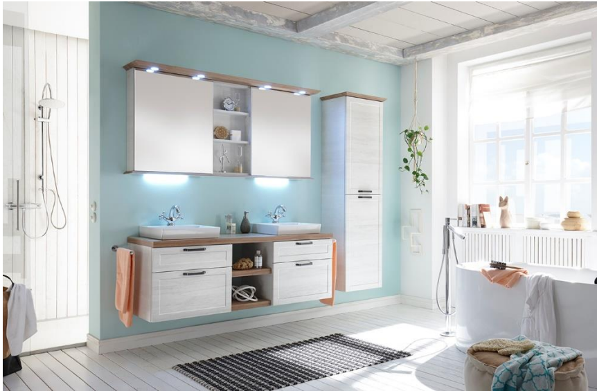
Spiegelschrank mit offenem Regal und LED-Beleuchtung im Kranz (Programm Solitaire 9030)