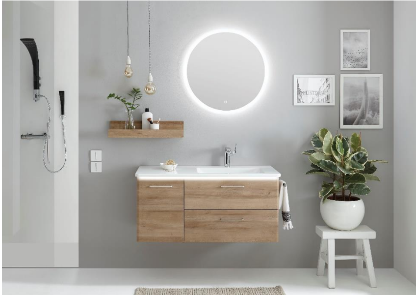
Runder Flächenspiegel mit LED-Effektlicht und Touchsensor (Programm Solitaire 7035)