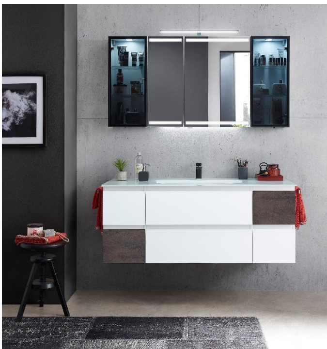
Spiegelschrank mit Aufsatzleuchte und LED-Effektlicht sowie Vitrinen rechts und links (Programm PCON)