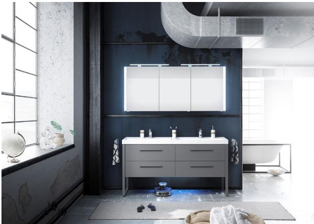
Spiegelschrank mit Aufsatzleuchten und seitlichen LED-Profilen (Programm Solitaire 9025)