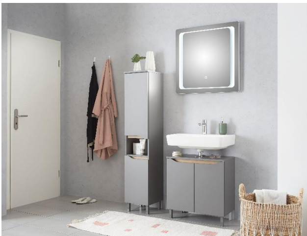
Flächenspiegel mit LED-Effektlucht und Touchsensor (Programm Capri)