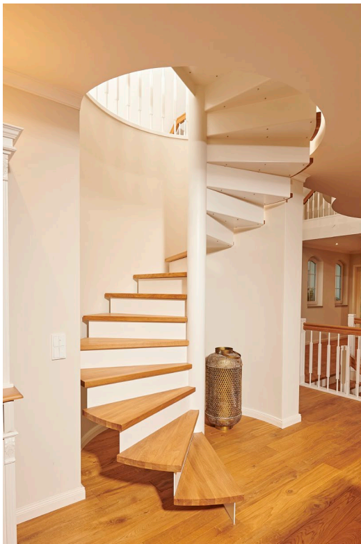
Spindeltreppe mit dynamischem Charakter