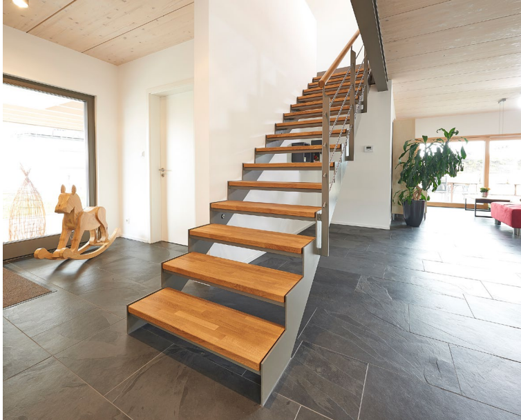
Zugleich modern und klassisch: gerade verlaufende Flachstahlterappe

aus Holz oder Messing zum Blickfang werden. Bei der Wahl aber immer zu beachten: Das Geländer hat in erster Linie eine Sicherheitsfunktion und sollte nach entsprechenden Kriterien gewählt werden – hier lassen Sie sich am besten von den Experten von Fuchs-Treppen beraten.