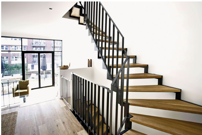
Stahlgeländer mit industriellem Charme