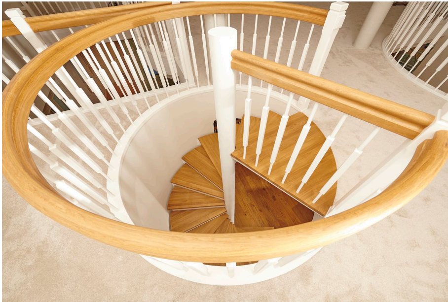
Zeitlos elegantes Holzgeländer