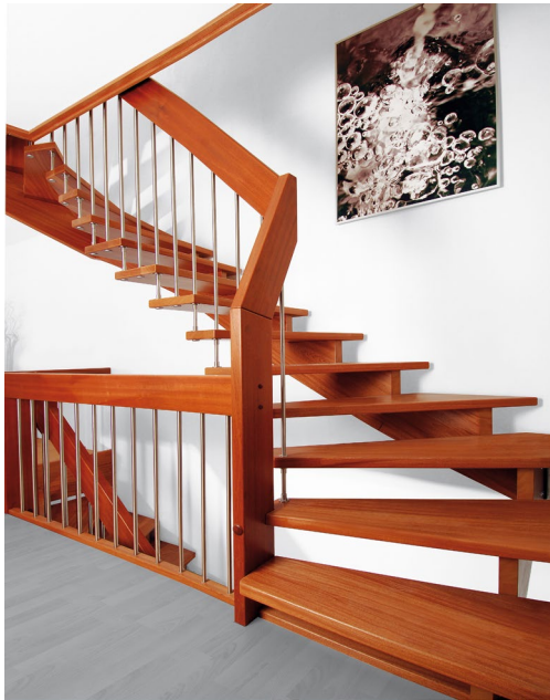
Treppe aus rötlichem Mahagoni-Holz