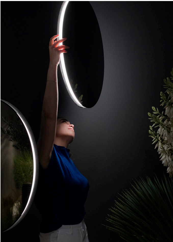
Se I eS.