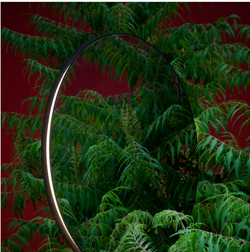
Se I eS.