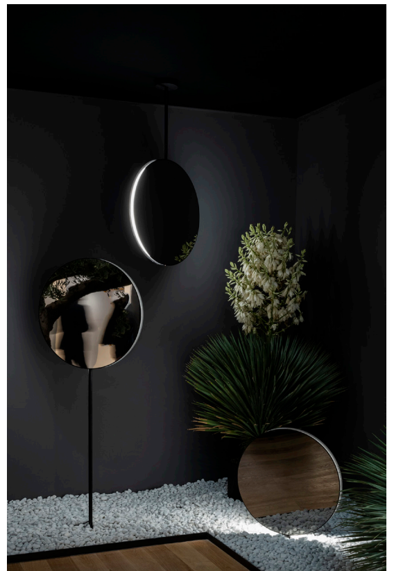
Se I eS.