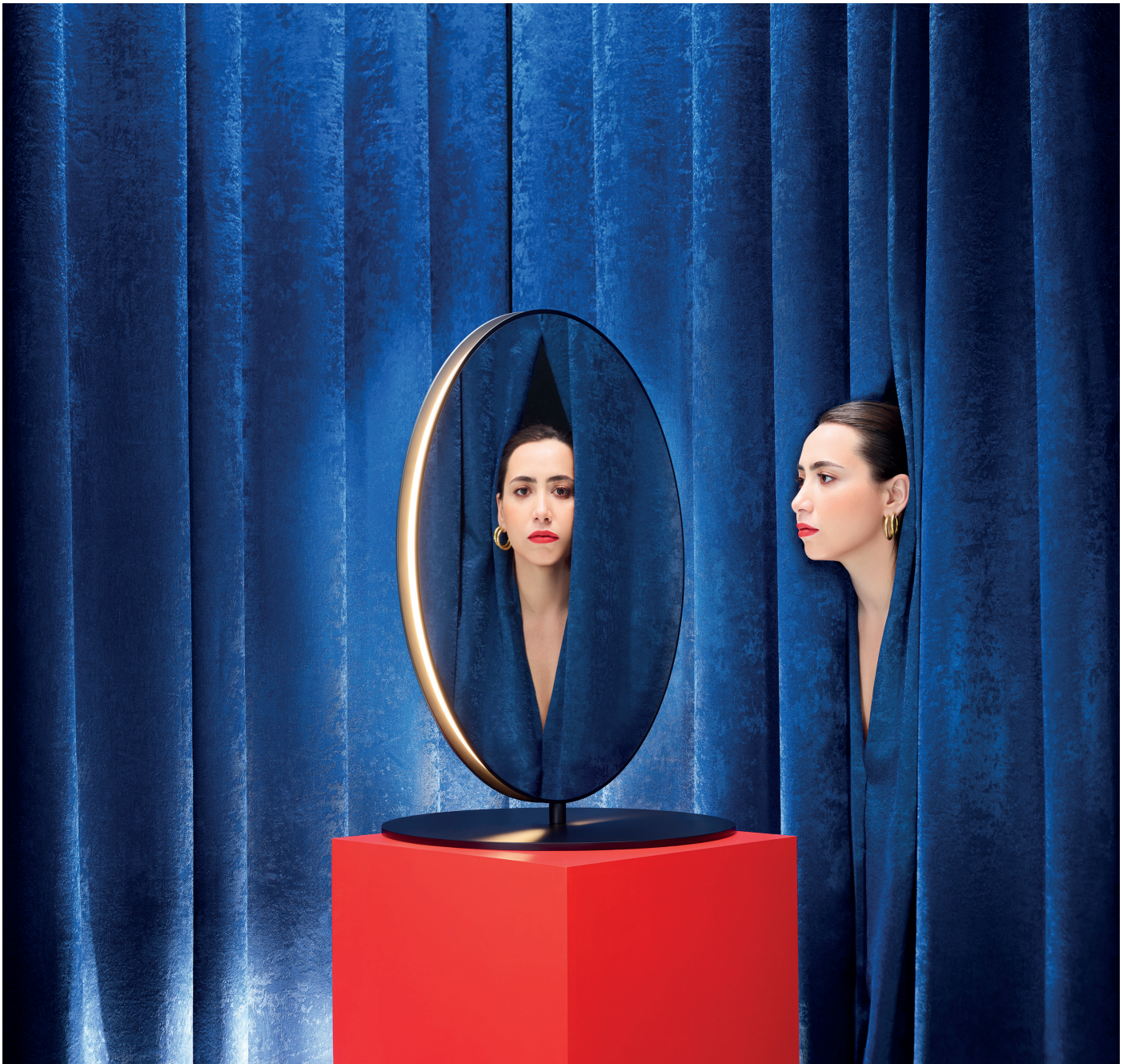
Se I eS.