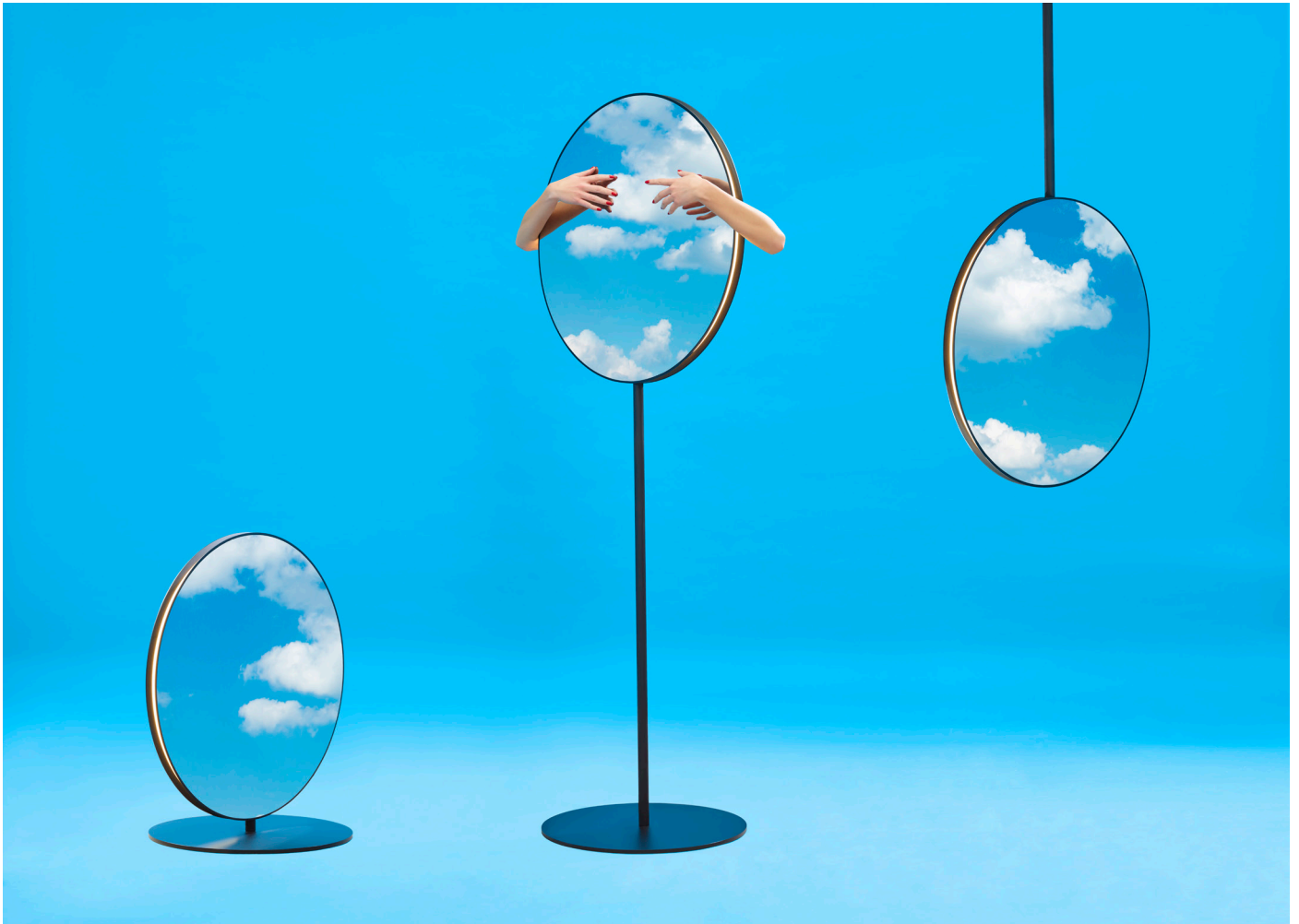
Se I eS.

Wie ein räumliches Palindrom, das sich in den Spiegelungen seiner Umgebung verbirgt, mutet Se|eS an. Die Leuchte besteht aus zwei verspiegelten Scheiben, zwischen denen sich rundum ein zurückversetztes, homogenes Licht befindet. Sowohl für Innen- als auch Außenräume geeignet, reflektiert sie die Architektur, schafft neue Perspektiven und interagiert mit der Dynamik der umgebenden Natur. Ausrichten lässt sich Se|eS elegant über die vertikale Achse. Zwei unterschiedlich hohe Bodenleuchten und eine Pendelleuchte erlauben es, verschiedene Blickwinkel und Reflexionen einzufangen, um die Raumwahrnehmung zu verändern und szenografische Landschaften zu schaffen. Im Vergleich dazu verfügt die neue Wandversion über eine geringere Größe: Sie erzeugt so ein intimes Ambiente und macht Se|eS noch flexibler anwendbar, um das Leben in all seinen Spiegelungen einzufangen.