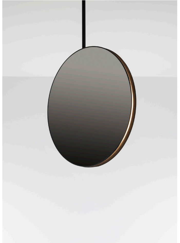
Se I eS. Bilder: ©Artemide