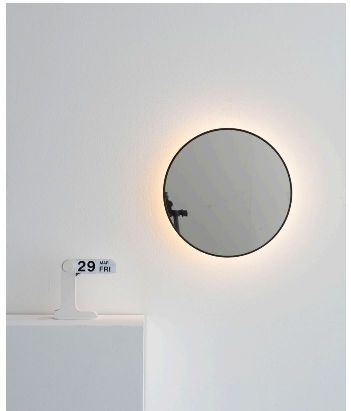
Se I eS.