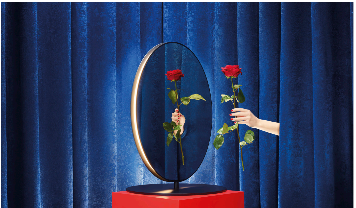
Se I eS.