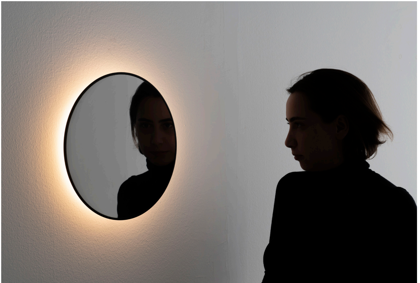
Se I eS.