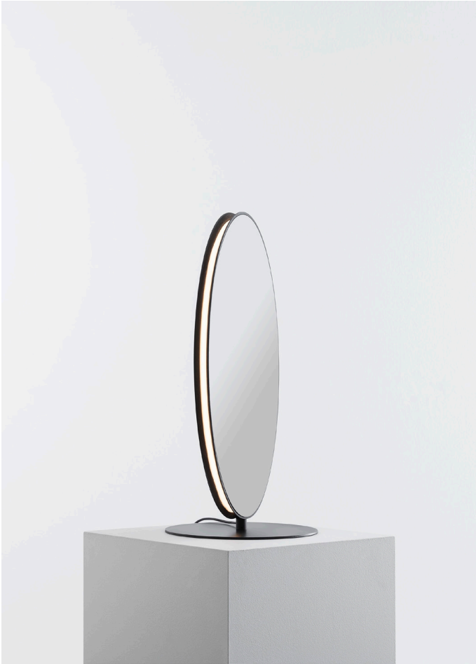
Se I eS.