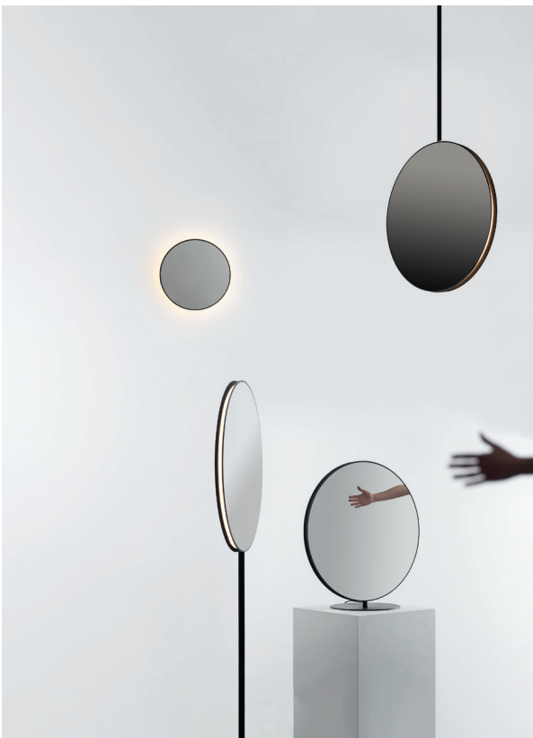
Se I eS.