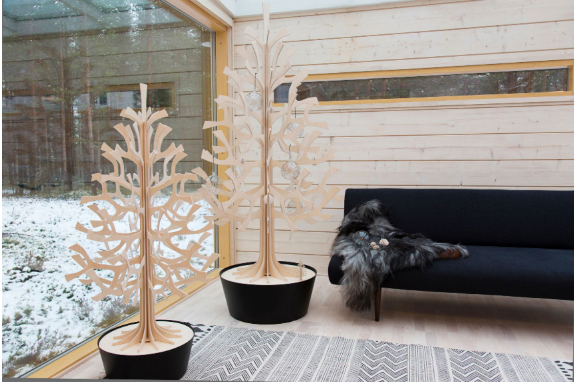
Nachhaltige, lebensgroße Birkenperrholzbäume aus dem hohen Norden sind schadstofffrei, robust und perfektes Wohnaccessoire.

Weihnachten ist in Finnland eine besonders besinnliche Zeit, welche über Jahrhunderte von traditionellen, festlichen Bräuchen geprägt ist. Das Land im hohen Norden, wo die Englein scheinbar die Plätzchen backen und der Weihnachtsmann sein Quartier hat, sind atemberaubende Wälder, Seen und Tierarten zuhause, auf Finnisch „Koti“ . Diese einzigartige, idyllische Kulisse schafft eine magische Atmosphäre für Feierlichkeiten an den stimmungsvollen Festtagen.