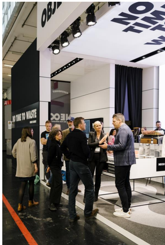
OBJECT CARPET Messestand auf der BAU.