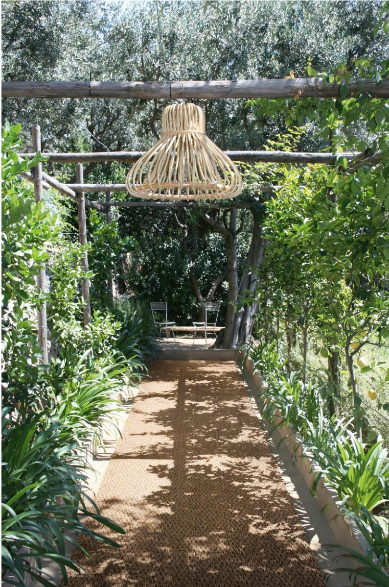
MEDITERRANEO für In- und Outdoor - designed by Matteo Thun &amp; Antonio Rodriguez