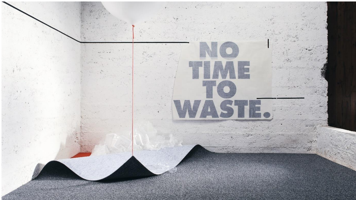
NEOO – der erste zirkuläre Mono-Carpet aus 100 % Polyester