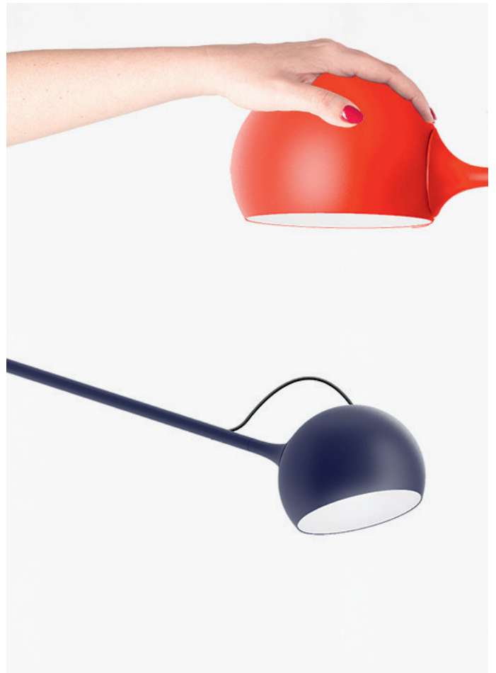
Ixa XL.