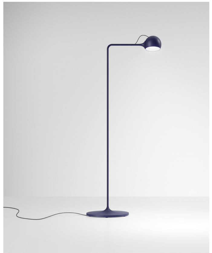
Ixa. Bilder: ©Artemide