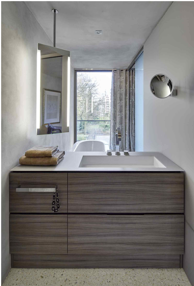
Bespoke im Projekt Stadthaus Palmaille.

bespoke von Alape: individuell zugeschnittene Projektlösungen von A-Z