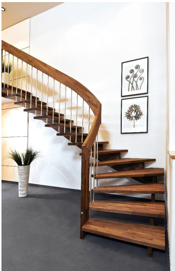
Geländergetragene Treppe, Nussbaum