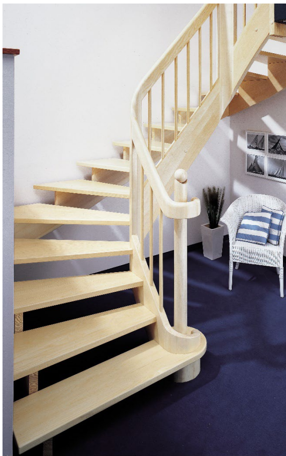
Wangentreppe, Esche gebleicht