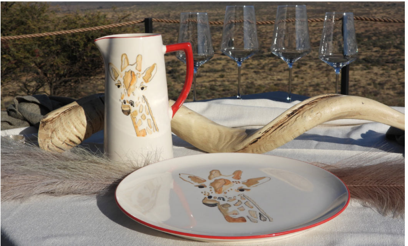
Wildtierzeichnungen spiegeln die faszinierende Wildtierpopulation Namibias wider.