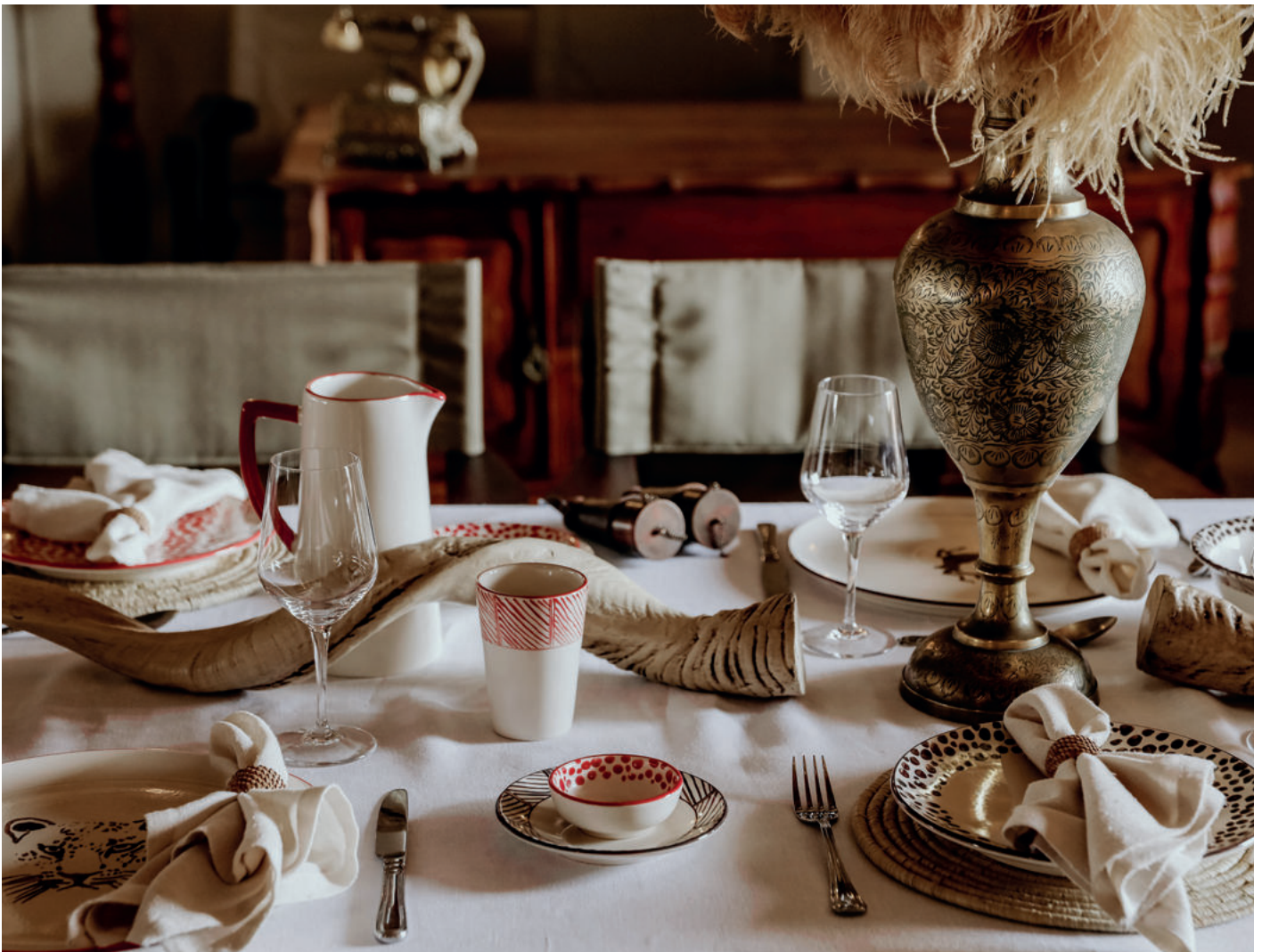
Die „Afrika Edition“ von Gmundner Keramik ist eine künstlerische Fusion von lebendigen Farben und traditionellen Mustern, welche die reiche kulturelle Vielfalt des afrikanischen Kontinents zelebriert.

„Namib“ hingegen trägt den Namen der Küsten- und Nebelwüste, die als älteste Wüste der Welt gilt. Die Ränder der Geschirrteile sind hier mit braunen und roten Stricheln bemalt. Darüber hinaus dürfen auch Tierzeichnungen nicht fehlen – schließlich beherbergt Namibia eine der faszinierendsten Wildtierpopulationen Afrikas. Stilisierte Zebras und Giraffen, Löwen, Elefanten und andere zieren daher den großen Wasserkrug und die dazu passenden Teller. Abgerundet wird die „Afrika Edition“ mit der Neuinterpretation des klassischen Gmundner Hirsches, der hier als Kudu zum Sprung ansetzt.