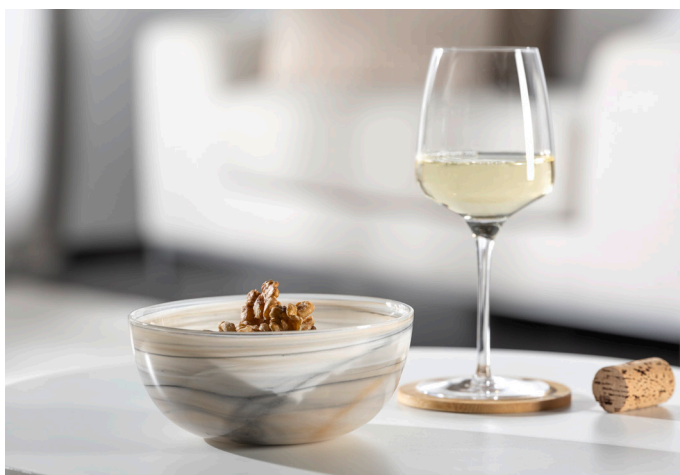
ALABASTRO und CESTI