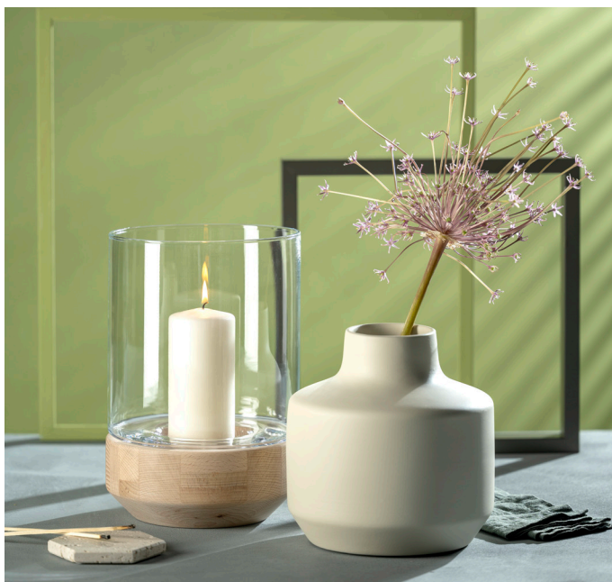
LEGNO und MILANO