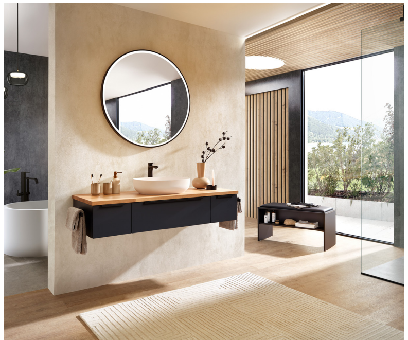
PCONcompact wirkt scheinbar schwerelos und entfacht dadurch eine moderne Dynamik im Bad. Das Design ist auf das Wesentliche reduziert und bietet mithilfe durchdachter Konzeption viel Stauraum an.

Pelipal hat diese Entwicklung erkannt und bietet eine exquisite Auswahl an Badmöbeln, die nahtlos in die Architektur des Raumes integriert werden können. Eine offene Raumgestaltung mit wenig Abgrenzungen ist dabei willkommen. Eine freistehende Badewanne mit direktem Blick auf Waschbecken und Handtuchhalter wirken dynamisch und verschaffen der Atmosphäre mehr Leichtigkeit. Die Verbindung von Funktionalität und Design in Badmöbel zu integrieren, macht das Unternehmen aus Schlägen zu einem Vorreiter in der Schaffung fugenloser Bäder, die Luxus und Leichtigkeit vereinen.