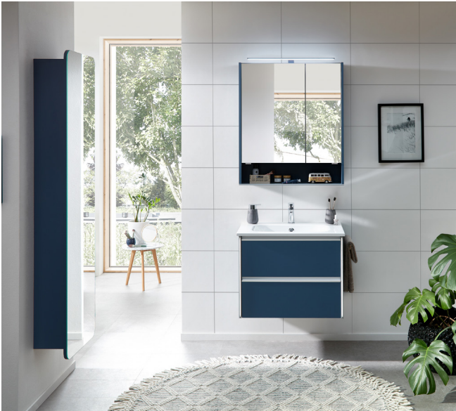
Kontrastreiche Akzente im Badezimmer verleihen dem Raum eine ansprechende Dynamik, indem sie durch satte Farben wie die neue Farbe Baltic Blau bei Pelipal für moderne Eleganz sorgen. Serie 6040, © Pelipal