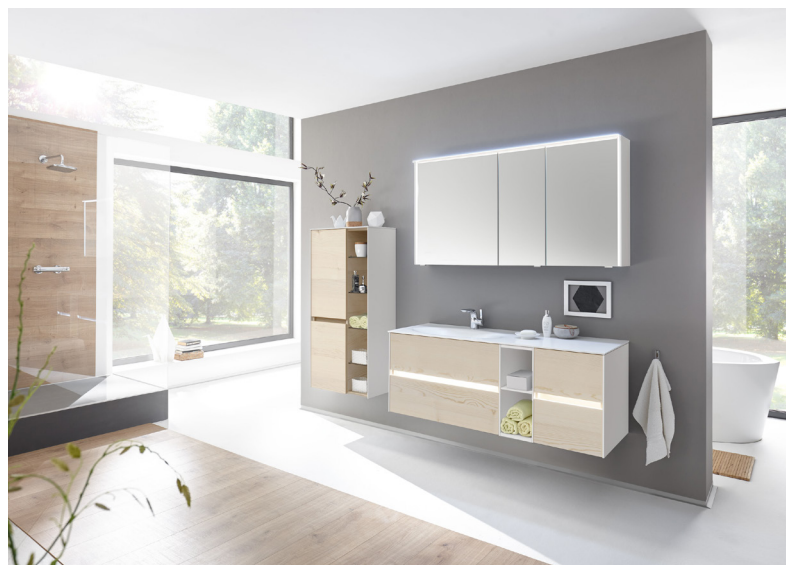
Fugenlose Bäder im Jahr 2024: Modern, hygienisch und stilvoll – der Trend setzt auf nahtlose Ästhetik und praktische Eleganz. Serie 6010