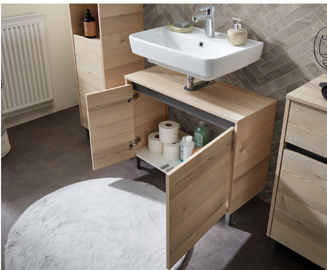
Die Serie Quickset von Pelipal präsentiert sich als zerlegtes Möbel, das Zuhause einfach und bequem aufgebaut wird – für eine moderne Badgestaltung. Serie Quickset

Quickset von Pelipal ist im Handumdrehen mitgenommen und aufgebaut. Die einfache Montage, der zerlegten Möbel ist ohne aufwendige handwerkliche Arbeiten möglich und schafft damit eine zeitsparende sowie hochwertige Umgestaltung des Badezimmers. So kreieren DIY-Enthusiasten ebenso wie ungeduldige Gemüter einfach und bequem, stilvolle Wellnessoasen im eigenen Zuhause. Die Serie verbindet modernes Design mit Benutzerfreundlichkeit. Neue, frische Farbkombinationen sorgen für Variantenvielfalt verbunden mit den bekannten Qualitätsstandards von Pelipal – Made in Germany.