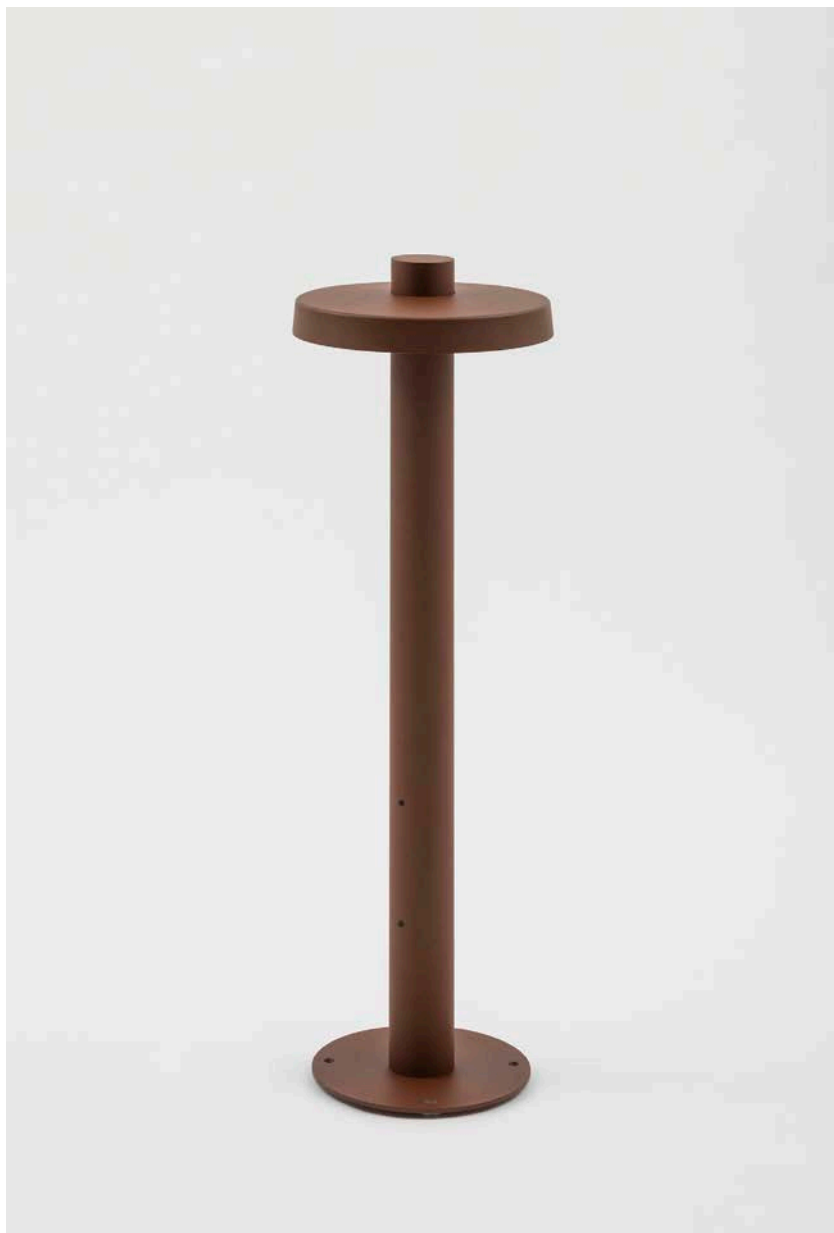
Needoo, © Artemide