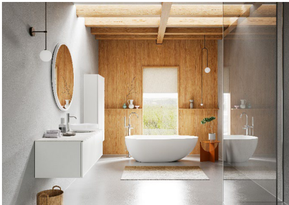
„Ein herausragendes Beispiel im Badmöbelbereich“ – Die Jury des German Design Awards lobt „Arkta“ für seine Vielseitigkeit und elegante Gestaltung.