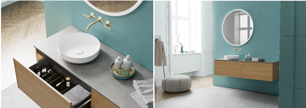
Flexibilität trifft Ästhetik – Dank vielseitiger Oberflächen und Griffvarianten passt sich „Arkta“ jedem Wohnstil an.