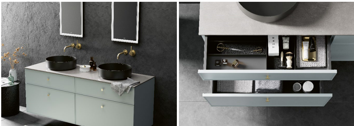
Die Badserie „Arkta“ von Alape überzeugt mit klaren Linien, natürlichen Materialien und hoher Variabilität.