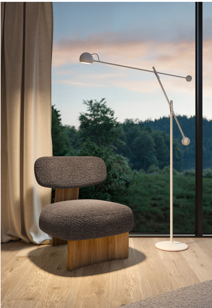
Leuchte „Ixa“ von Artemide. © Artemide; elliot Lounge-Chair, © TEAM 7