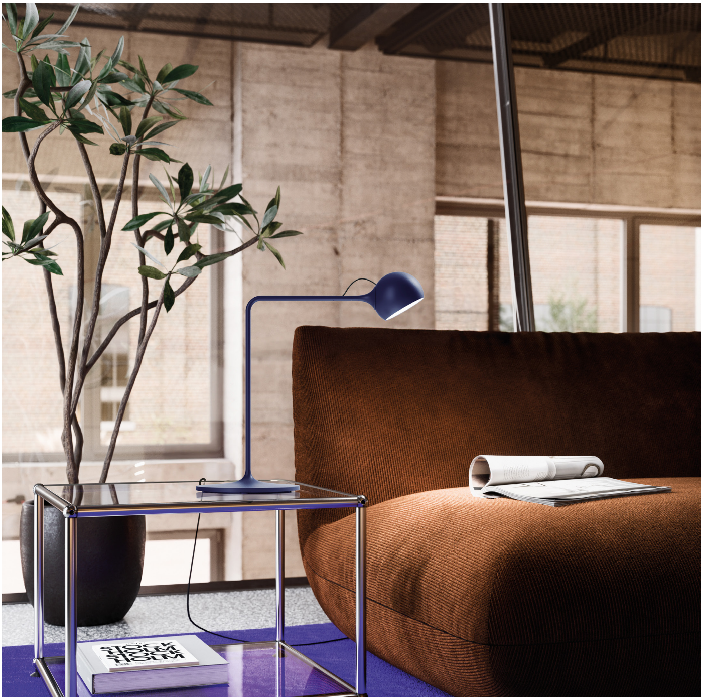
Leuchte „Ixa“ von Artemide. © Artemide