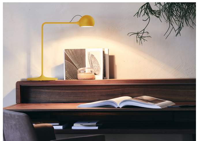
Leuchte „Ixa“ von Artemide.