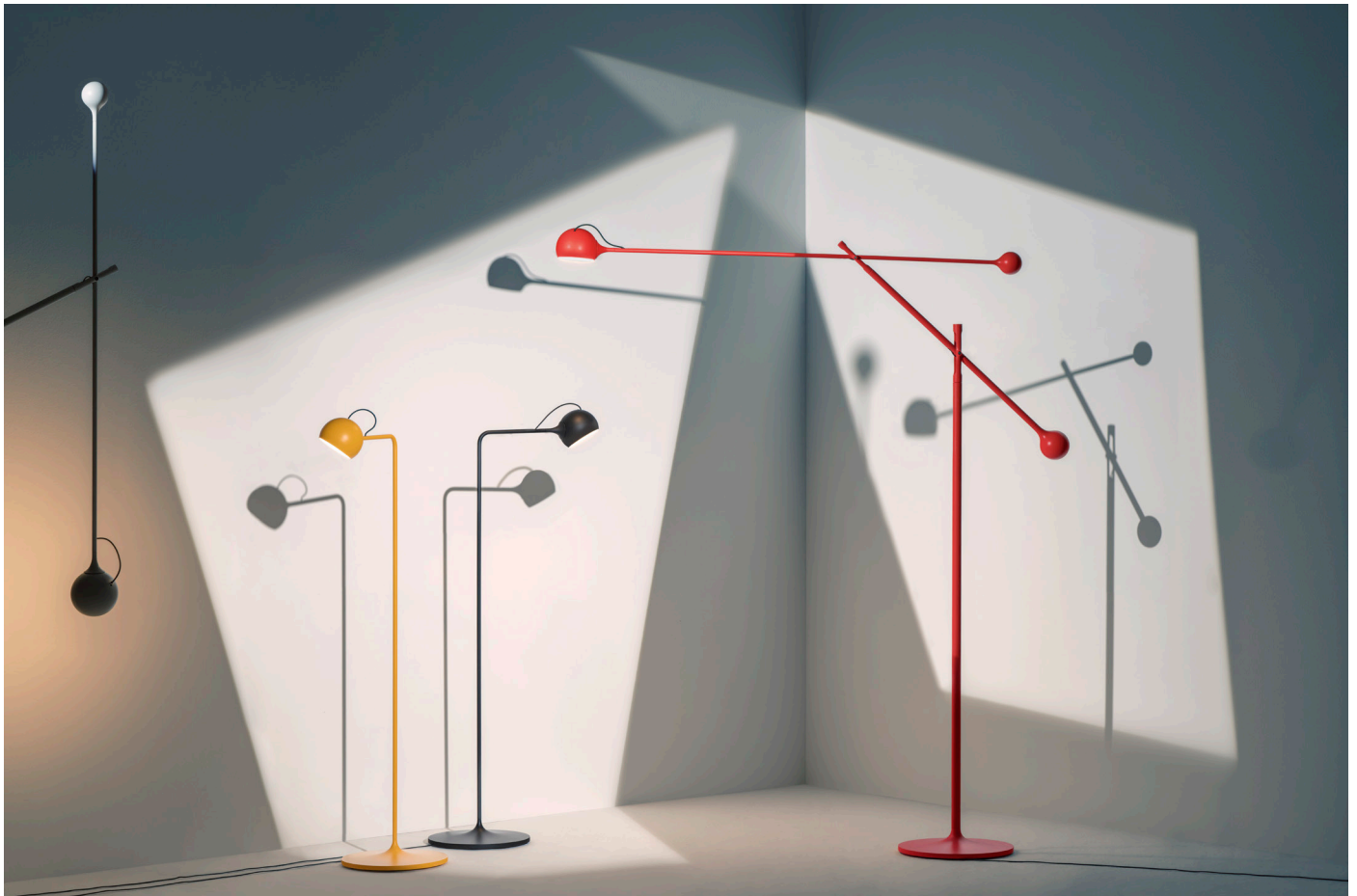
Leuchte „Ixa“ von Artemide in unterschiedlichen Farben und Ausführungen. © Artemide

Die berühmten Mobiles des Künstlers Alexander Calder verbinden Bewegung und Balance. Scheinbar mühelos schweben die abstrakten, farbenfrohen Metallkonstruktionen in der Luft. Inspiriert von Calders Skulpturen, verkörpert Ixa von Artemide dynamische Eleganz durch Präzisionstechnik. Die raffinierte Leuchte lässt sich frei im Raum ausrichten und bringt das Licht exakt dorthin, wo es benötigt wird.