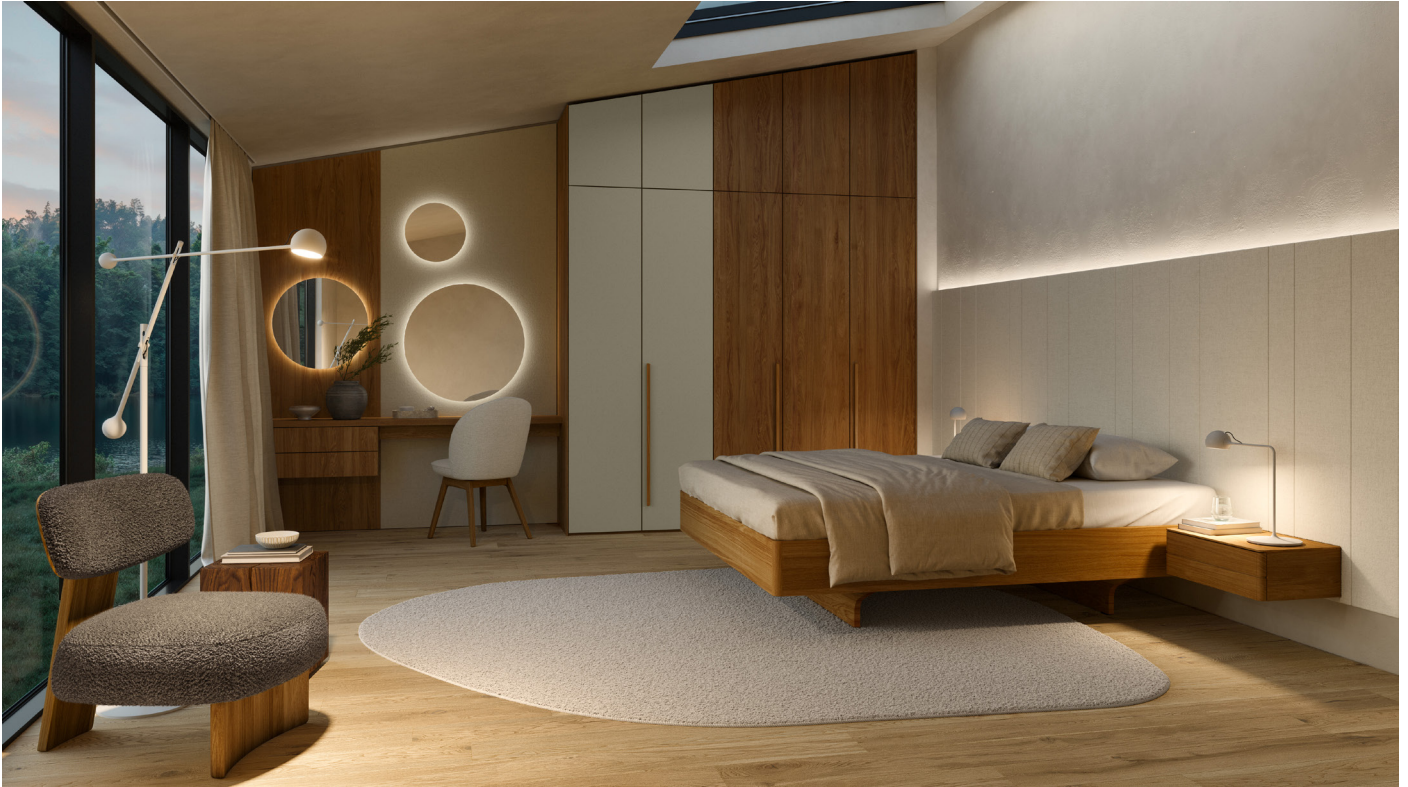
Leuchte „Ixa“ von Artemide. © Artemide; elliot Lounge-Chair, © TEAM 7