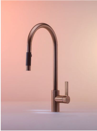
Stilprägend, markant, edel – Tara Ultra in Bronze gebürstet.