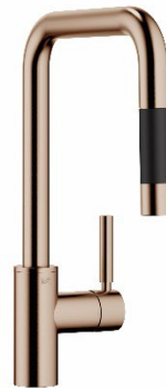
Tara Ultra und Meta Square in Bronze gebürstet: Designklassiker im eleganten neuen Gewand.