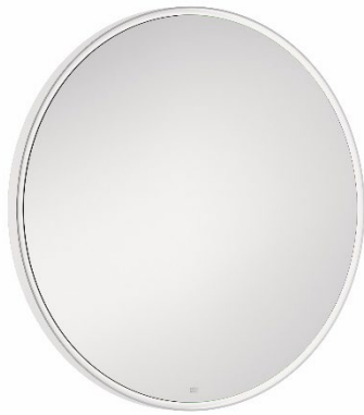
Runder Lichtspiegel mit umlaufender LED-Beleuchtung in Weiß.