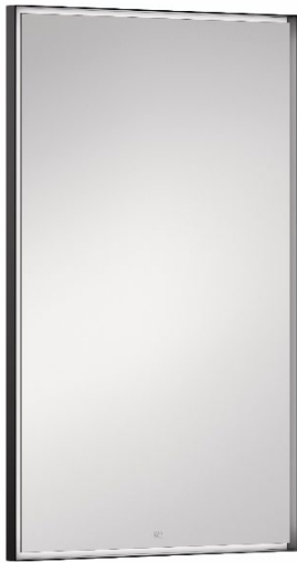
Eckiger Lichtspiegel mit umlaufender LED-Beleuchtung in Schwarz.