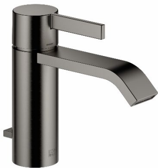
IMO in Dark Platinum gebürstet: Der vergrößerte Einhebelmischer verfügt über eine Ausladung von 135 mm und eignet sich besonders für größere Waschtische.