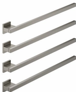
Handtuchwärmer in eckiger Ausführung mit vier Heizstäben in Dark Platinum gebürstet.