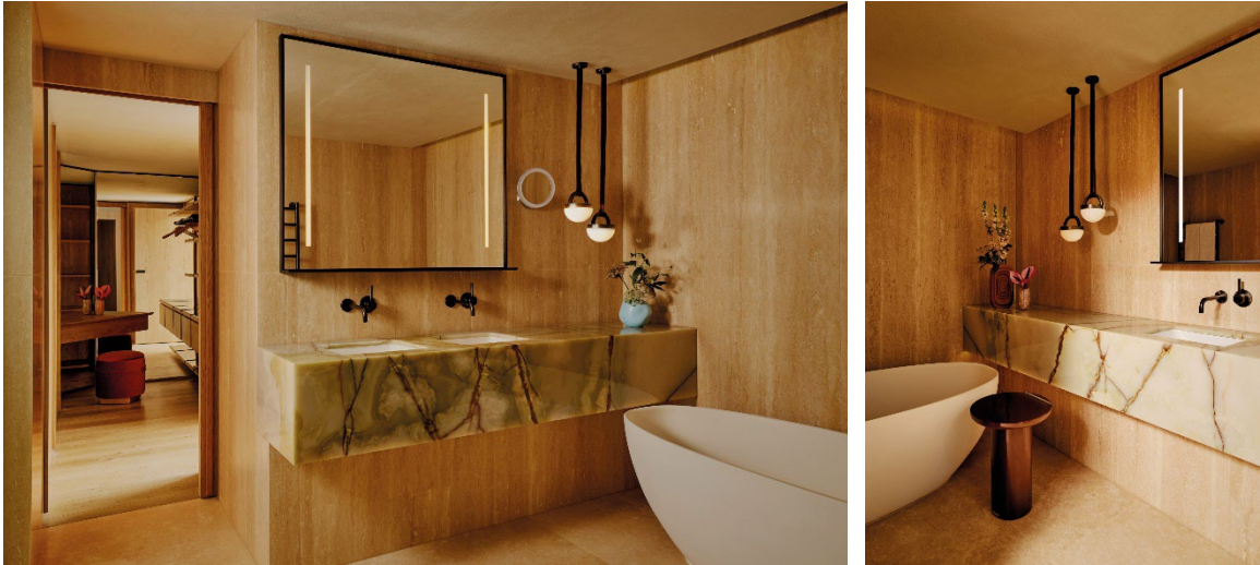
Meta in Dark Platinum gebürstet in der Balcony Park Suite (links) und der Park Junior Suite (rechts): Gemeinsam mit den dunklen Leuchten und Spiegelrahmen setzen die Armaturen einen auffälligen Akzent.