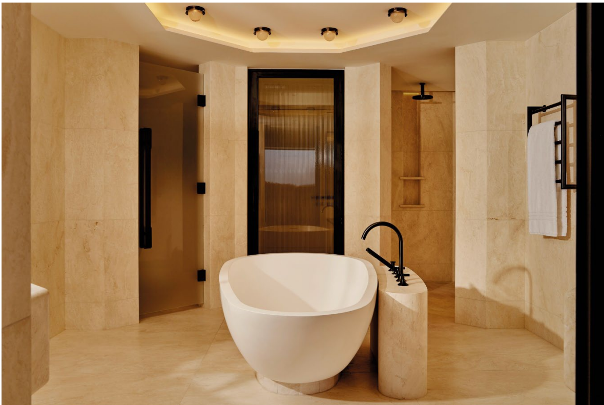
In der Park Suite vollendet Vaia in Dark Platinum gebürstet das exklusive Badensembel, das eine Atmosphäre von Klarheit und Luxus erzeugt.