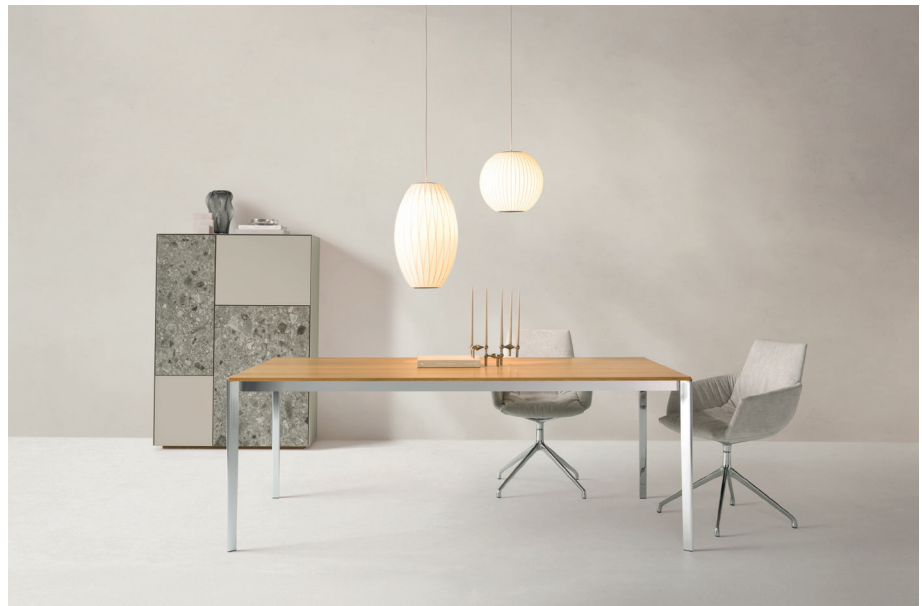
lui léger Stuhl mit Maple 112, tak Tisch und cubus pure Highboard

Gestaltungstipp: Maple 112 passt perfekt zum neuen Farbglaston greige, um ein modernes und zugleich klassisches Ambiente zu kreieren.