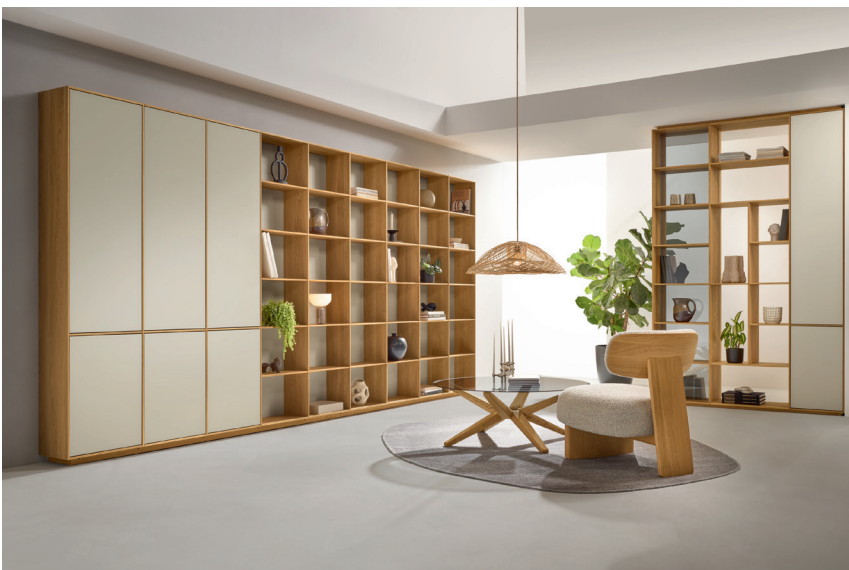
filigno Regalsystem mit Farbglas greige

Als harmonische Verschmelzung von Beige und Grau strahlt die neue Glasfarbe eine natürliche, zeitlose Eleganz aus. Zugleich kühl und warm, modern und klassisch setzt die dezent Nuance sanfte Akzente im Interior Design. Ob glänzend oder matt – der neue Greige-Ton ist vielseitig kombinierbar und fügt sich in jedes Ambiente stilvoll ein. Durch seine dezenten Ästhetik entsteht eine ruhige, ausgeglichene Atmosphäre.