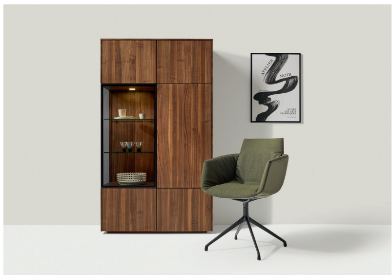
grand lui Stuhl mit Clara 793 und filigno Highboard

Gestaltungstipp: Neben der Stoffvariante ist das Olivgrün auch als neue Lederfarbe verfügbar. Fein aufeinander abgestimmt ergeben sich daraus harmonische Kombinationen, z. B. für den lui Stuhl im Materialmix.