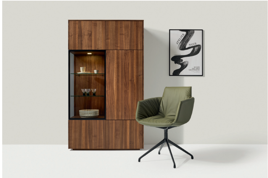
grand lui Stuhl mit L1 olive und filigno Highboard

Gestaltungstipp: Die neue elegante Lederfarbe harmoniert insbesondere mit der edlen Ausstrahlung von Nussbaum. Aber auch mit hellen natürlichen Akzenten wie der Glasfarbe greige ergeben sich stimmige Kombinationen.