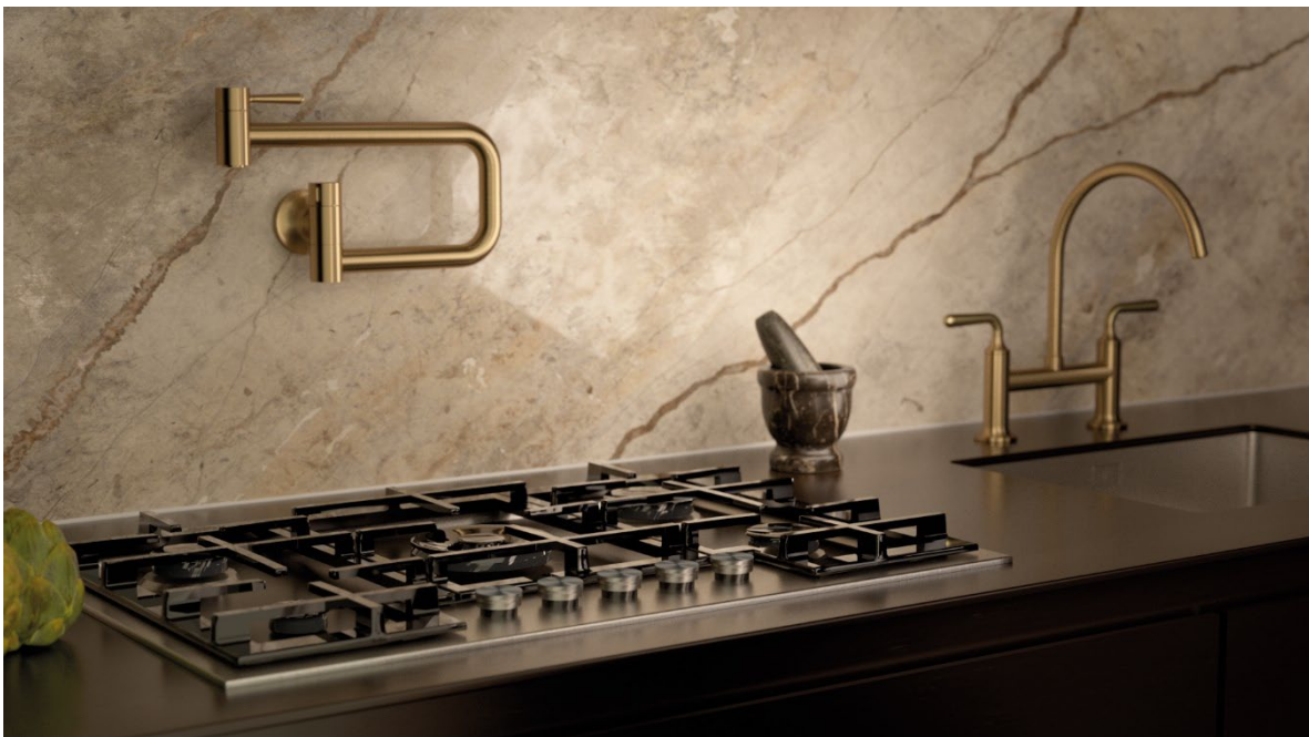
Vaia in Dark Brass gebürstet als Potfiller: Eine spezielle Bürstung verleiht der Oberfläche ihr anregendes, facettenreiches Farbspiel.