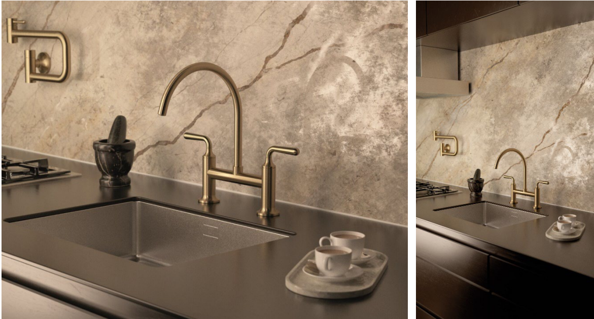
Vaia als Brückenbatterie in Dark Brass gebürstet: Der dunkle Messington hebt sich elegant von der dunklen Arbeitsfläche und dem Hintergrund aus gemasertem Naturstein ab.