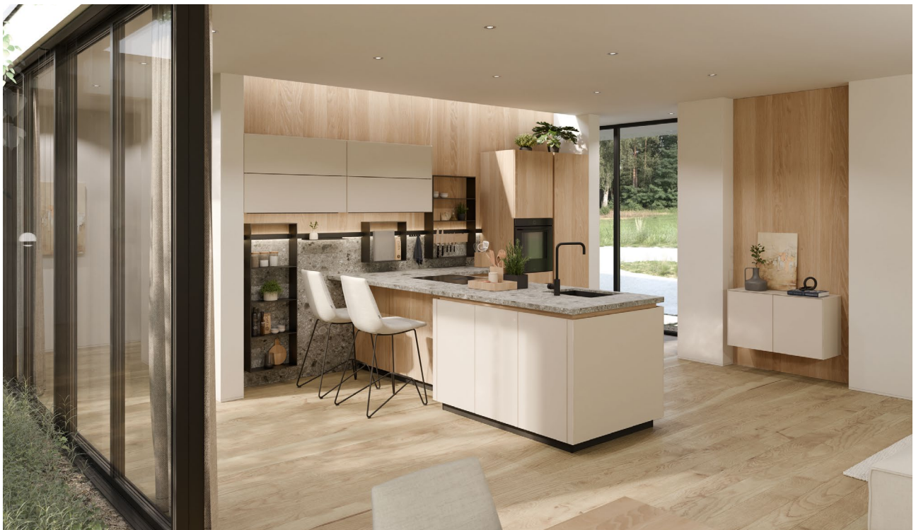
oben echt.zeit Küche, unten pur Küche