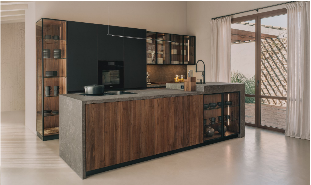
black line Küche

Eine Küche ist viel mehr als der Ort, an dem Speisen zubereitet werden: Hier wird gekocht, gegessen, gelacht – und auch mal getanzt und gefeiert. Ob zum schnellen Frühstück mit den Kindern vor der Schule, zum gemeinsamen Zubereiten des Lieblingsgerichts mit der ganzen Familie oder zur ausgelassenen Kochsession mit Freunden am Wochenende: In der Küche trifft man sich, denn sie ist der Mittelpunkt eines jeden Zuhauses, in dem sich von früh bis spät das Leben abspielt. Genau deshalb sollte man der Planung und Gestaltung dieses Raumes viel Aufmerksamkeit widmen und auf kompetente Partner setzen. So wie auf den österreichischen Premium-Hersteller TEAM 7, der Naturholzküchen mit viel Know-how, Liebe zum Detail und einem Höchstmaß an Individualität in Österreich fertigt.